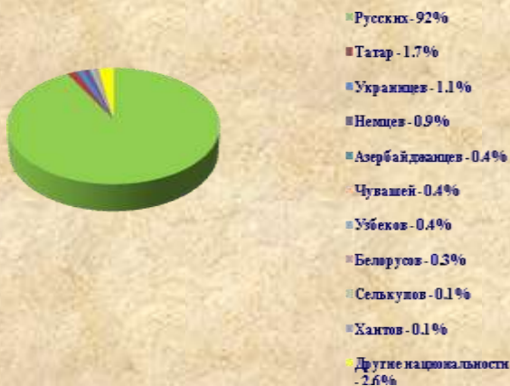
Численность национальностей Томской области, %

В соответствии с Конституцией Российской Федерации национальная принадлежность в ходе опроса населения указывалась самими опрашиваемыми на основе самоопределения и записывалась переписными работниками строго со слов опрашиваемых. По итогам Всероссийской переписи населения 2010 года удельный вес наиболее многочисленных национальностей в Томской области составил: русских – 92 %, татар – 1.7 %, украинцев – 1.1 %, немцев – 0.9%, азербайджанцев – 0.4 %, узбеков – 0.4 %, чувашей – 0.4%, белорусов – 0.3 %, селькупов – 0.1%, хантов – 0.1%. Доля других национальностей суммарно составила 2,6%.